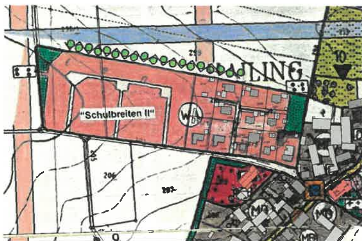
Derzeitige Ausweisung im FNP