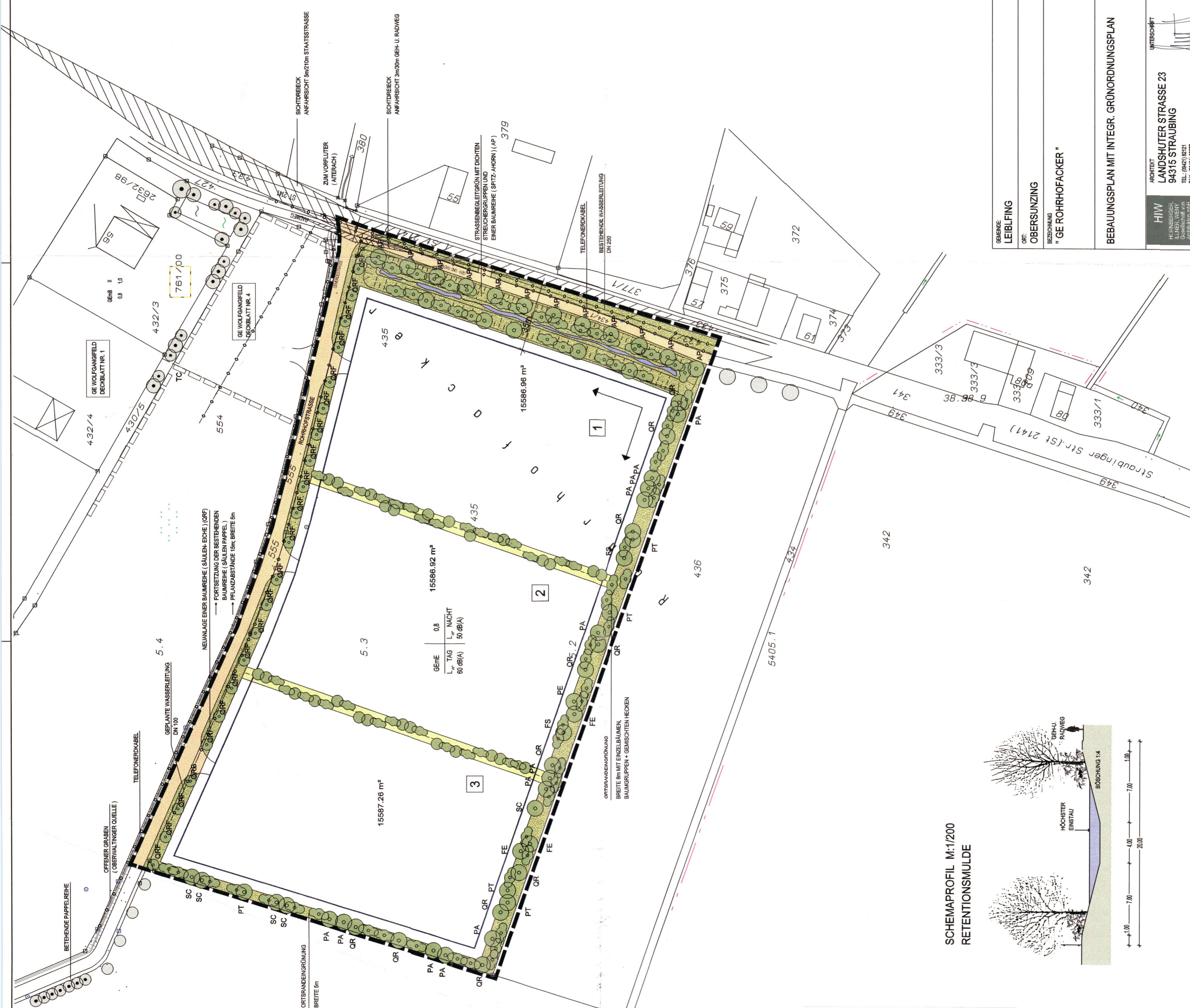
SCHEMAPROFIL M:1/200 RETENTIONS MULDE