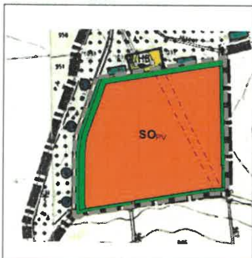
Flächennutzungsplan Deckblatt Nr. 25